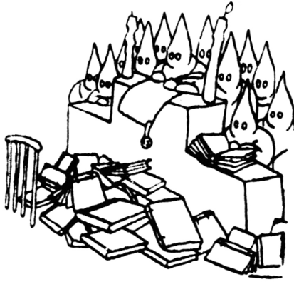
Les Treize, vus par Gaillac